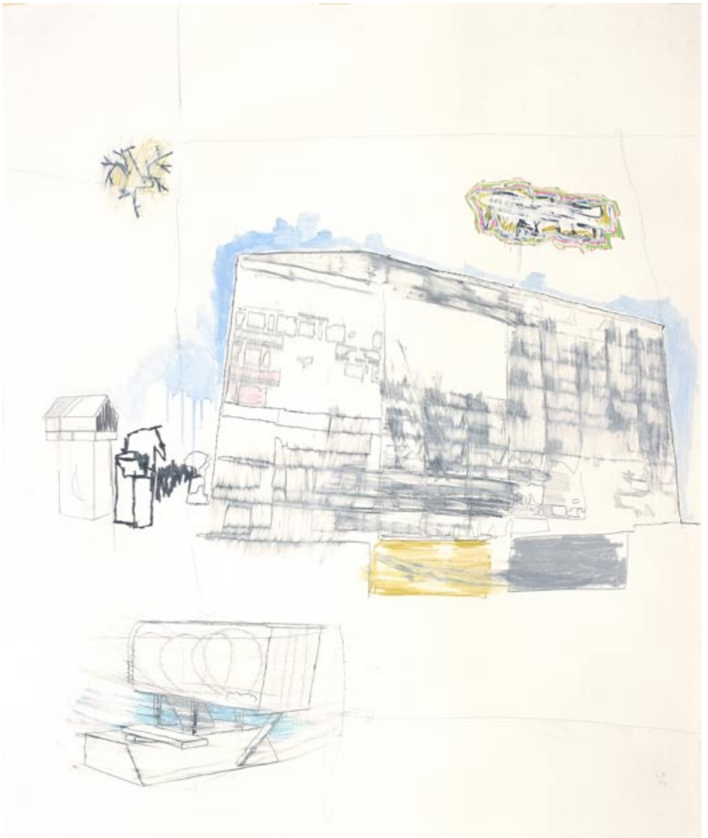
>display 016<, Mischtechnik auf Papier, 2006, 125cm x 150cm