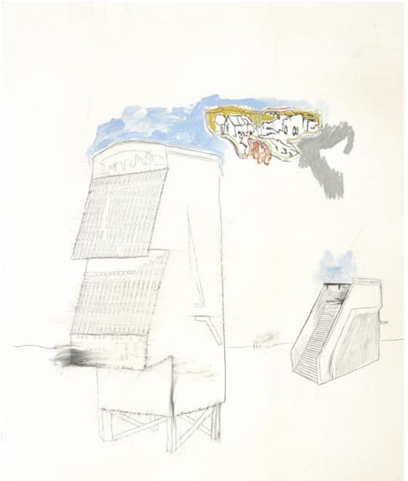
>display 017<, Mischtechnik auf Papier, 2006, 125cm x 150cm