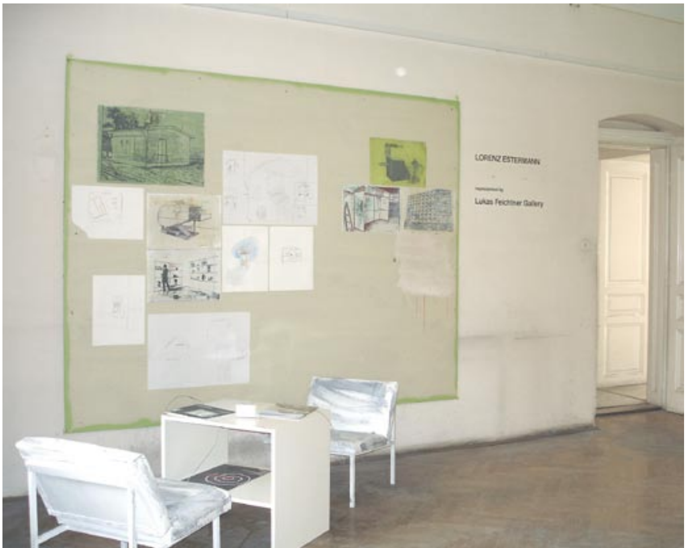
Raumsituation mit Lounge und Pinnwand