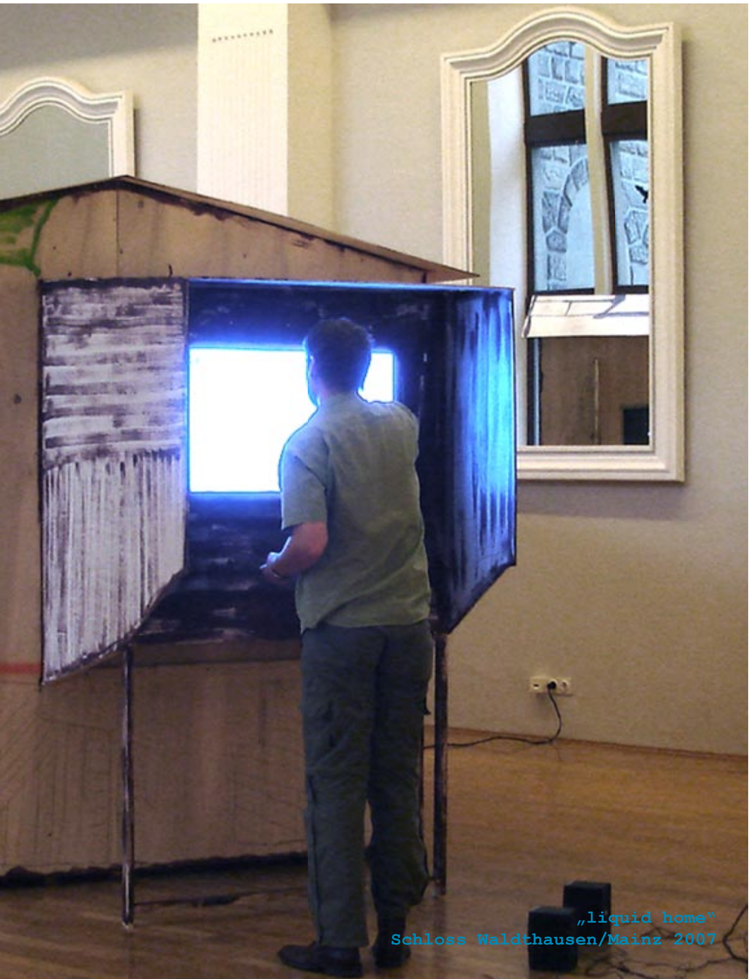
„liquid home“ Schloss Waldthausen/Mainz 2007