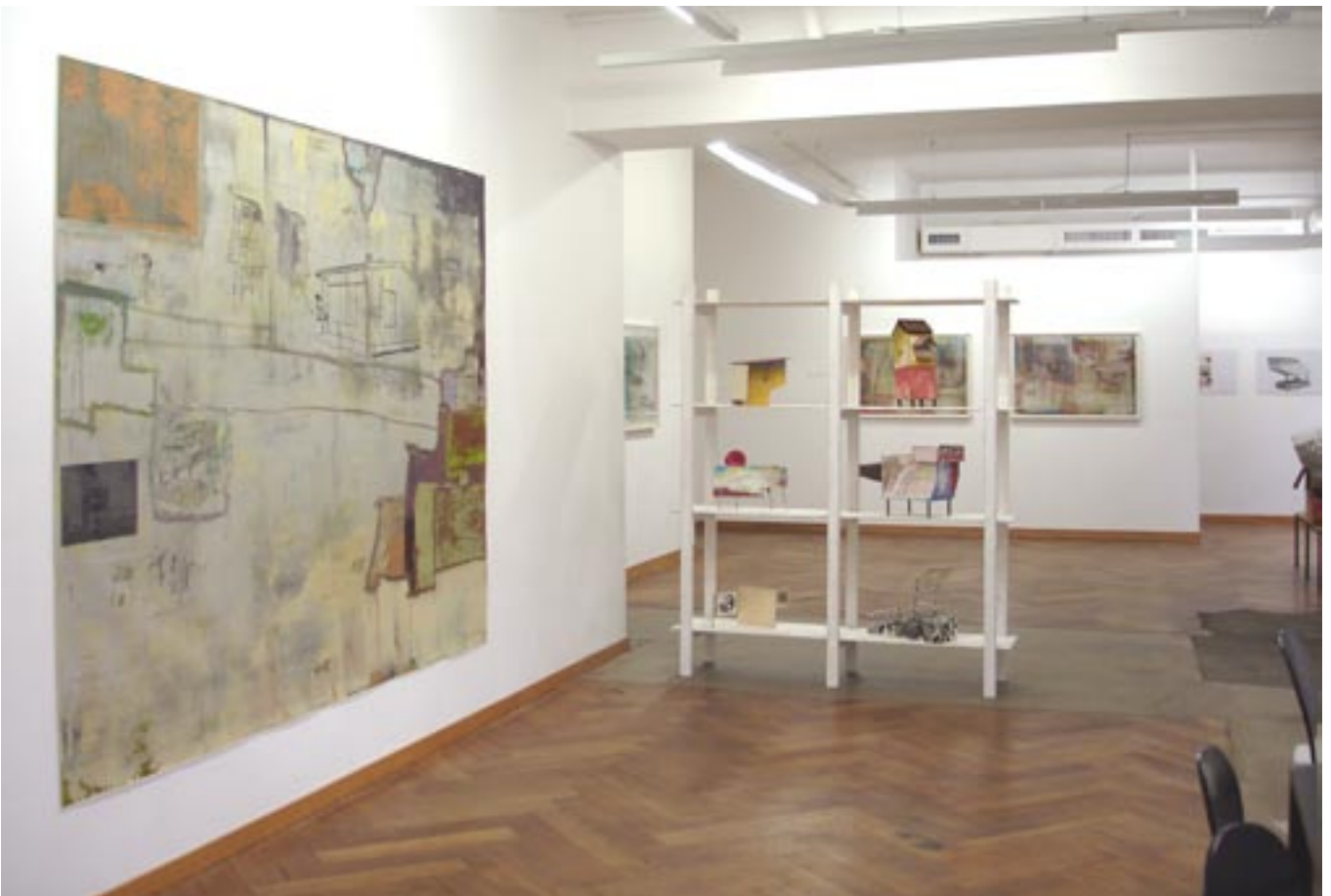
Ausstellungssituation Galerie UEKER&UEKER, Raum 1 und Raum 2