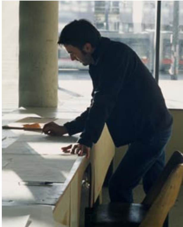
T-mobile Projektatelier 2006/07, T-center Wien