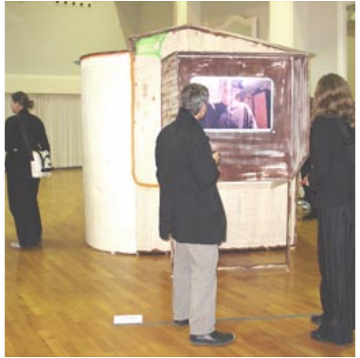
Ausstellungseröffnung Schloss Waldthausen, Installationsbau >liquid home<