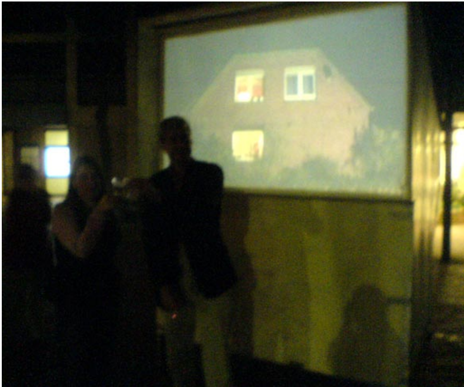
Präsentation zur langen Nacht der Museen Oldenburg 16.09.2006