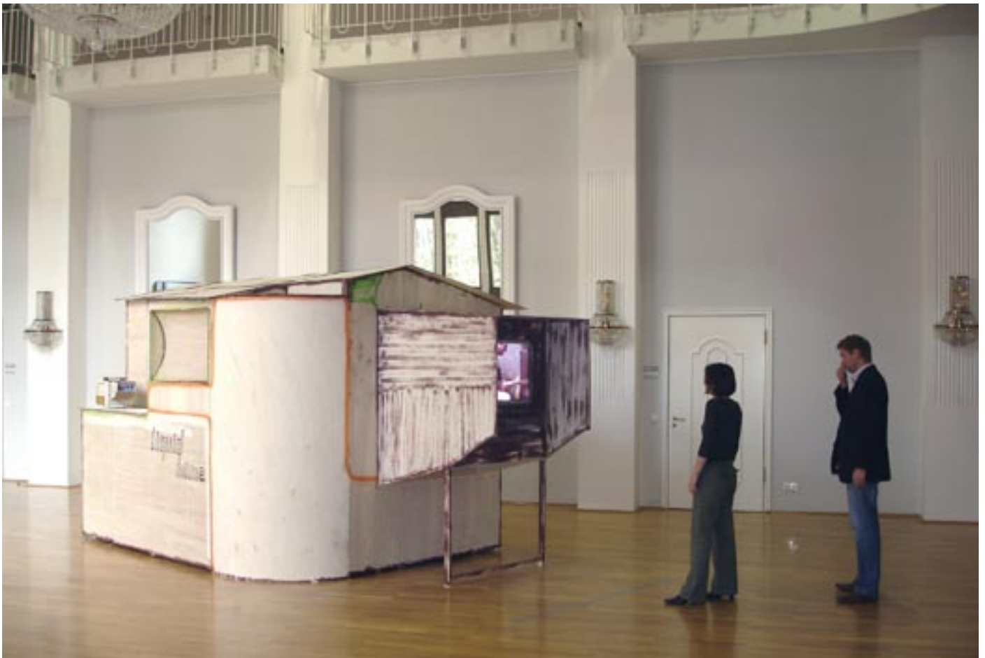
Ausstellungssituation Schloss Waldthausen (liquid home, >Monitor 1<)