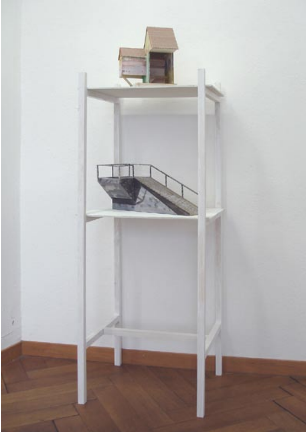
Regal mit Modellen