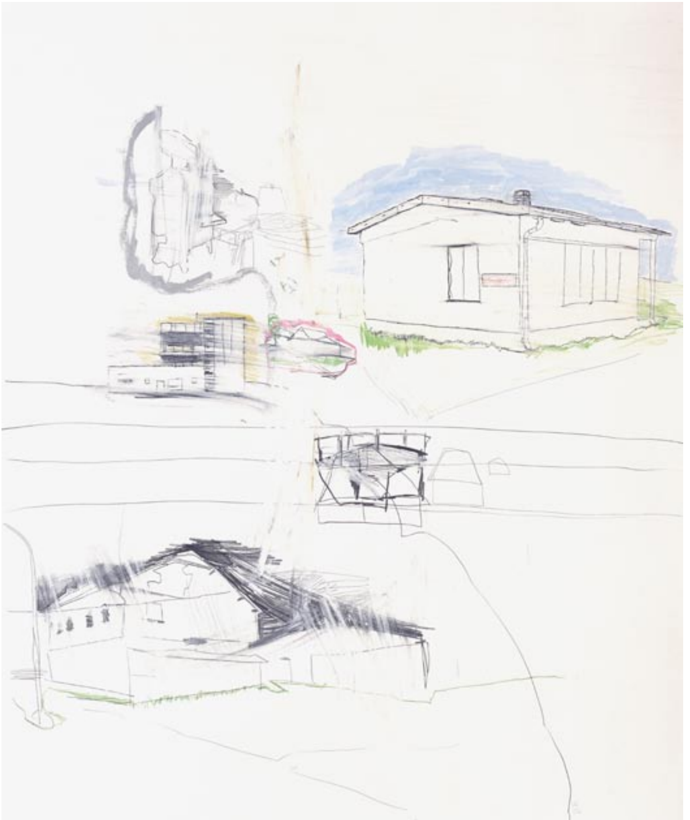
>display 013<, Mischtechnik auf Papier, 2006, 125cm x 150cm