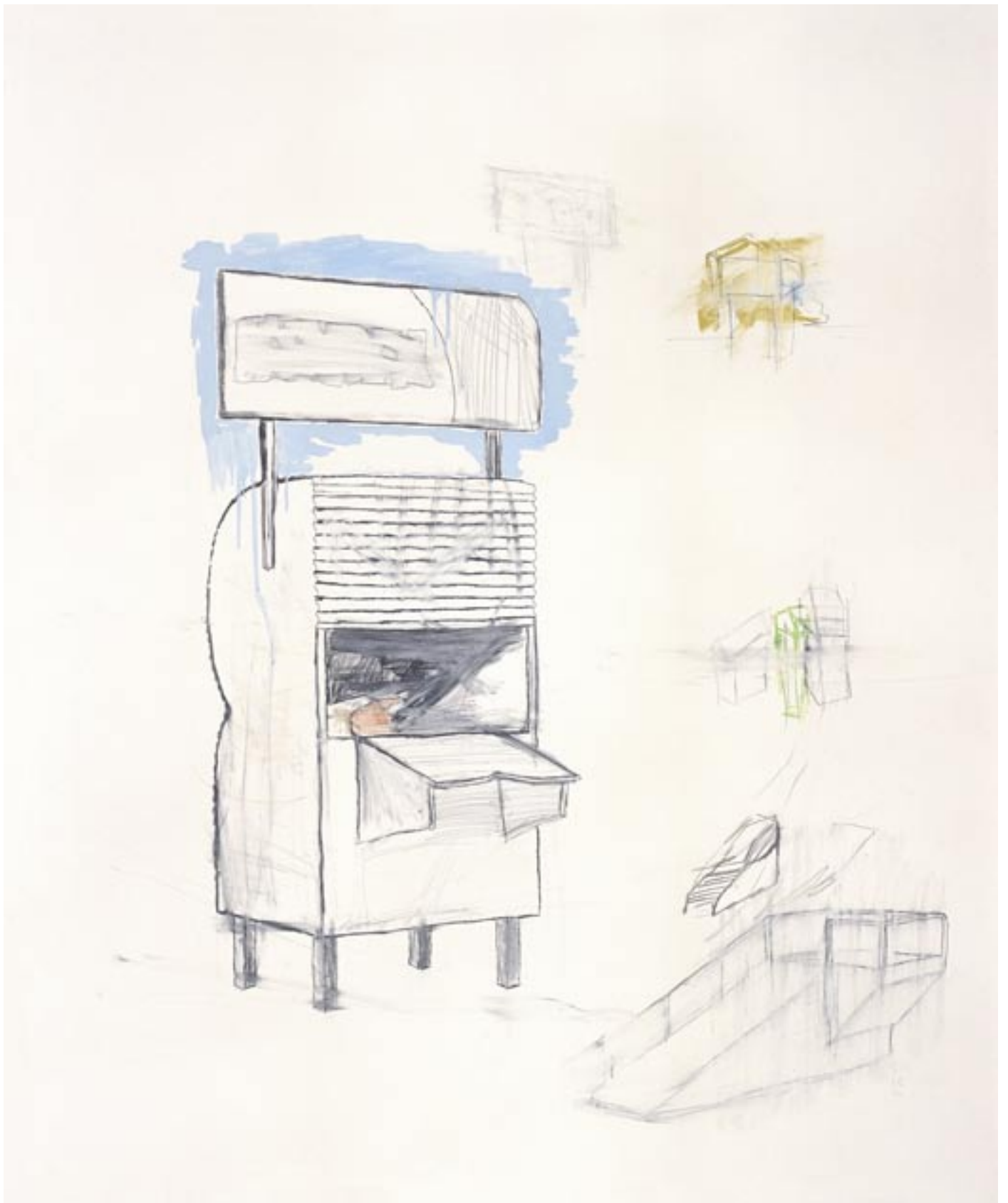
>display 015<, Mischtechnik auf Papier, 2006, 125cm x 150cm