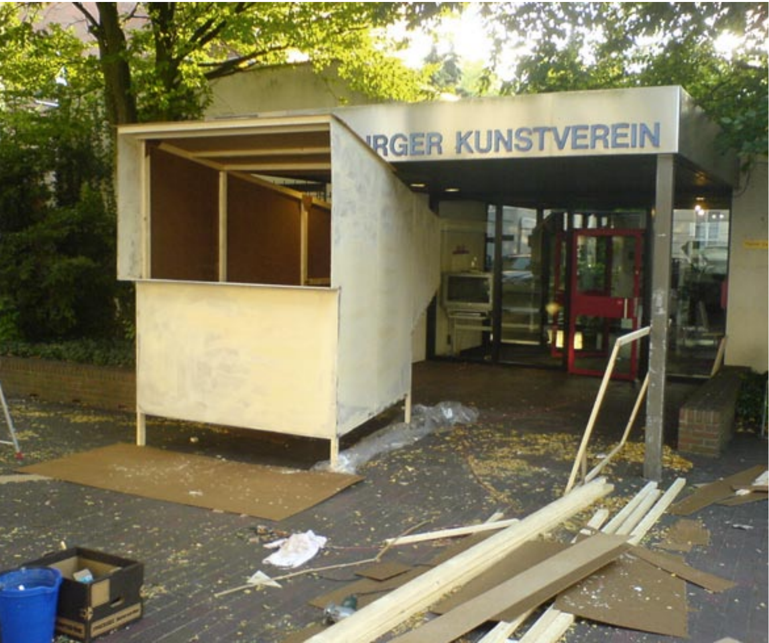
Oldenburger Kunstverein Aufbau der Installation